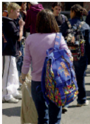
IN ANSIA Preoccupati anche i giovani