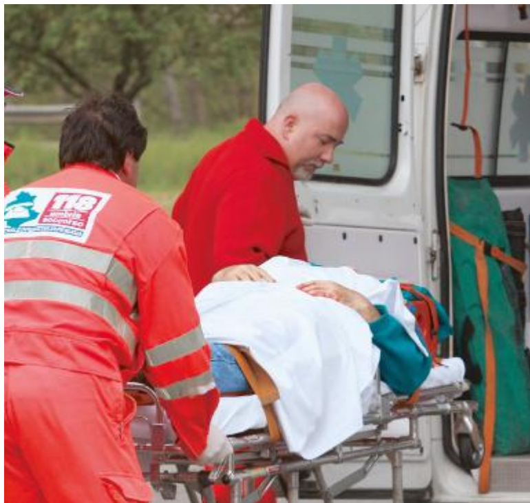
SOCCORSI Immediato l'intervento sul posto del 118

SONO STATI momenti drammatici. L'operaio ha chiesto aiuto, subito sono scattati i soccorsi, ma l'operazione per liberare la mano è risultata complessa e lunga: minuti interminabili, dolore infinito. L'uomo a quel punto è stato trasportato in ospedale a Catania. Purtroppo i danni all'arto sono risultati gravissimi, la mano com-