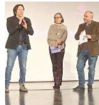
A organizzare "Libera"