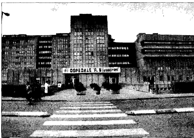
S.M. della Misericordia Il ferito ricoverato a Perugia

reggiata. Sul posto sono intervenuti i vigili del fuoco del comando di Assisi, che hanno aiutato a riportare il mezzo sulla strada, e i carabinieri della stazione di Santa Maria degli Angeli per i rilievi. Il conducente è stato trasferito all'ospedale Santa Maria della Misericordia, dove è ricoverato in prognosi riservata per il trauma cranico causato dall'impatto. Sembra comunque che non vi sia nulla da temere per la vita del guidatore. Molto spavento ma fortunatamente ferite lievi anche per uno scontro avvenuto a Bastia Umbra in pieno giorno, alle 16,30 circa, tra una Fiesta e una Volkswagen. L'impatto è avvenuto in località Santa Lucia, in prossimità dell'accesso alla quattro corsie. Sono rimaste ferite tre donne e una bambina di circa 4 anni; le vittime dell'incidente sono state trasporta-