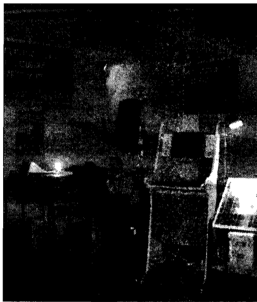
Lo stand dell'Istituto Marco Polo all'Expo