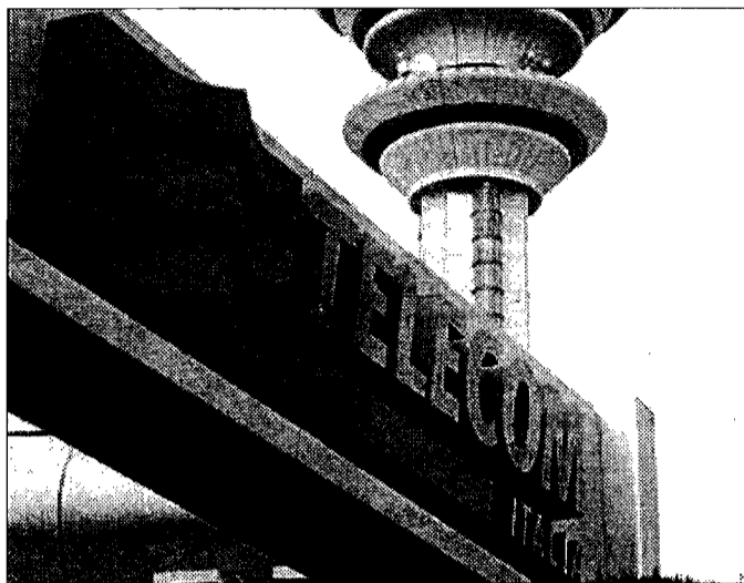
Protesta Inutili le richieste d'aiuto al call center Telecom

com, il 187, e anche all'ufficio commerciale, facendo presente la situazione ai diversi operatori che mi hanno risposto, ma tutto quello che mi hanno saputo dire è che sarebbe arrivato, entro breve, un tecnico che avrebbe risolto la situazione. Ma non si è visto nessuno. Più di due mesi dopo, nonostante io abbia pagato per avere una nuova linea, ancora nessuno si è presentato alla mia porta". L'unica parziale consolazione è che il cliente in questione è un privato cittadino e non un operatore commerciale, che avrebbe avuto un danno maggiore dal non avere una linea telefonica, ciò non toglie che due mesi senza telefono, a dispetto delle numerose chiamate effettuate ai diversi recapiti forniti dalla Telecom, farebbero perdere la pazienza anche a un santo. A complicare il tutto c'è che in Um-